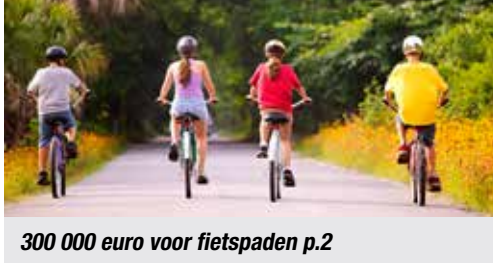
300 000 euro voor fietspaden p.2