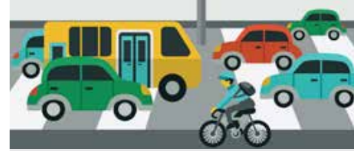
N-VA wil oplossing voor sluipverkeer p.3