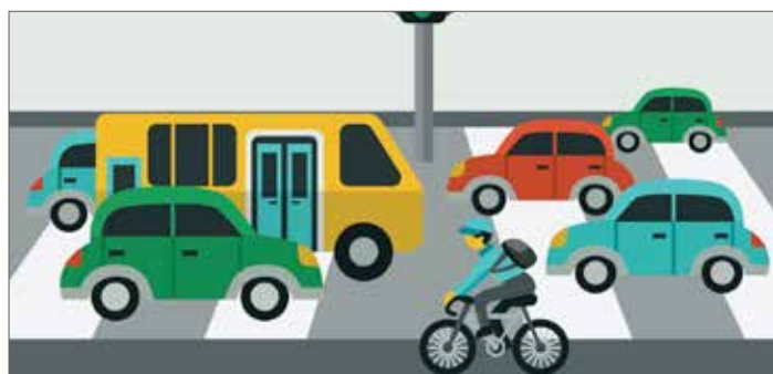
▲ De N-VA vraagt een oplossing tegen het sluipverkeer.

Sinds het sluiten van het kruispunt van de Gansbroekstraat met de A12 aan het knooppunt Boombrug is het tijdens de spits bijna onmogelijk de Sint-Katharinastraat op te rijden vanuit de zijstraten. Bovendien zorgen alle verkeerd geparkeerde wagens aan het Hof Van Zielbeek voor een bijzonder gevaarlijke situatie. Wanneer treedt het gemeentebestuur op?